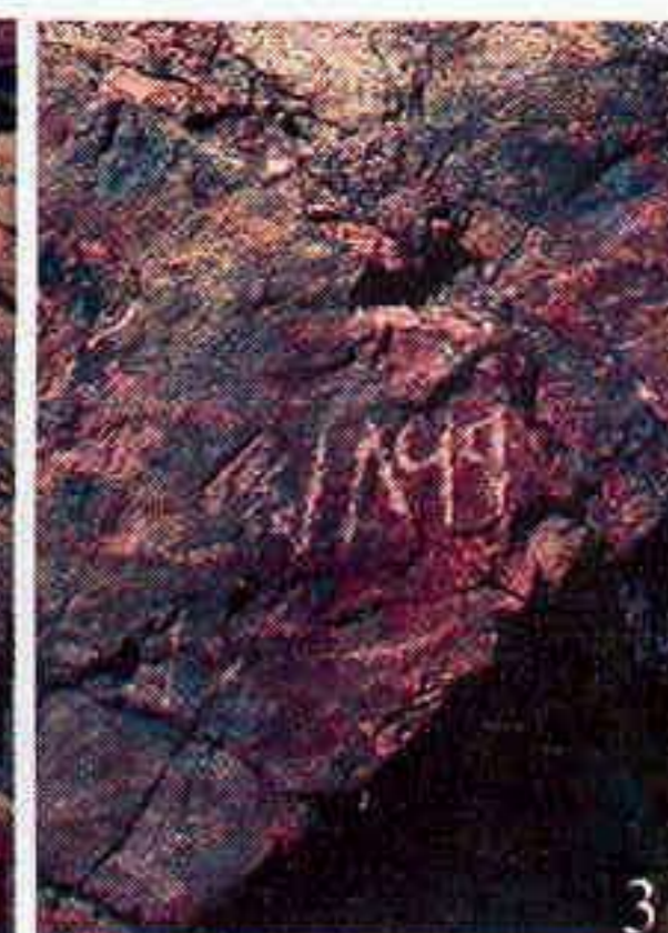
Рис. 6. Семиречье, Чу-Илийские горы, уроч. Серектас. Общий вид стоянки XIX в. и скалы (1) с тамгой шапырашты, именной надписью (2) и датой 1869 г. (3). 2007 г.