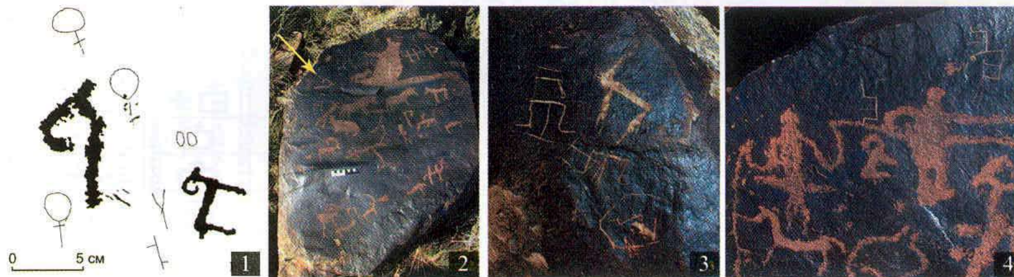
Рис. 3. Восточный Казахстан, Тарбагатай, уроч. Молдажар. Петроглифы с тамгами казахов Старшего и Среднего жузов (1, 2) и султанов (3, 4). Фото и прорисовка А. Е. Рогожинского. 2008 г.