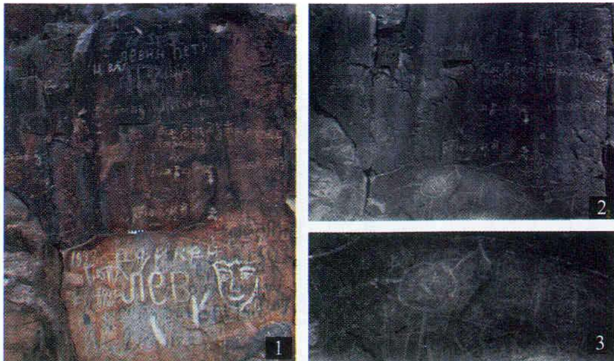
Рис. 7. Семиречье, Кегенский арасан. Скала с тибетскими надписями и казахскими тамгами XIX в. (1 – фото А. Е. Рогожинского, 2008 г.) 2, 3 – фото Н. Н. Пантусова, 1900 г. НА ИИМК РАН. РА. Ф. 1. 1901 г. Д. 2. Л. 122